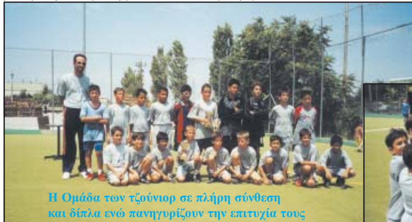
Η Ομάδα των τζούνιερ σε πλήρη σύνθεση και δίπλα ενώ πανηγυρίζουν την επιτυχία τους

Θυμηθείτε πως αυτοί που έφεραν τον ΟΦ Γέρακα στην Α' Αθήνας, ο προπονητής και οι περισσότεροι παίκτες ήταν Γερακιώτες.