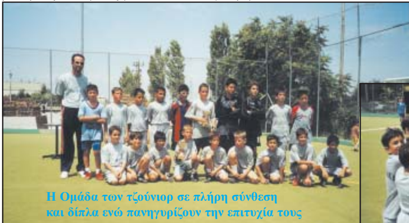
Η Ομάδα των τζούνιερ σε πλήρη σύνθεση και δίπλα ενώ πανηγυρίζουν την επιτυχία τους

Θυμηθείτε πως αυτοί που έφεραν τον ΟΦ Γέρακα στην Α' Αθήνας, ο προπονητής και οι περισσότεροι παίκτες ήταν Γερακιώτες.