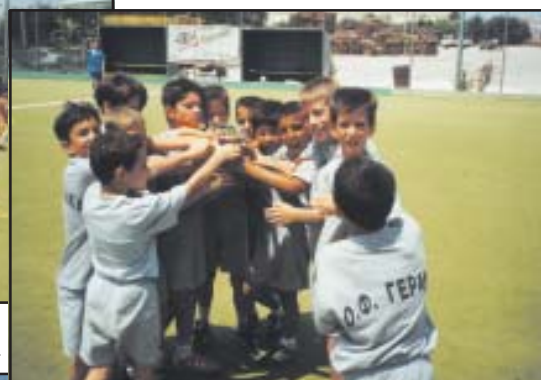
Η ομάδα των Παμπαίδων

Φέτος οι ομάδες των Ακαδημιών και των Παμπαίδων συμμετείχαν στα Πρωταθλήματα που διοργάνωσε η ΕΠΣΑ και στα οποία τα πήγαν αρκετά καλά. Οι μόνιμα Παμπαίδες κατέκτησαν την 2η θέση ενώ οι Τζούνιερς την 4η. Τέλος έκλεισαν την φετινή σεζόν με την συμμετοχή τους σε ένα ακόμα τουρνουά, που